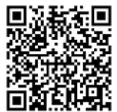
QR Code zur Spendenquittung

Er muss auf die Internetseite des Fördervereins der Linden- Grundschule ( http://www.linda-linde.de/ ) gehen und auf den Button „Spendenquittung Sponsorenlauf“ klicken oder er nutzt den abgebildeten QR Code. Hier kann er dann seine Daten (Namen, Adresse, gespendeter Betrag) eingeben. Die ausgefüllte Spendenquittung sollte dann von deinem Sponsor ausgedruckt werden und gemeinsam mit dem Geld an dich übergeben werden.